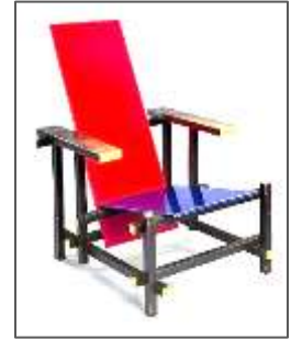
Fig.6 : La chaise bleu-rouge ,1917