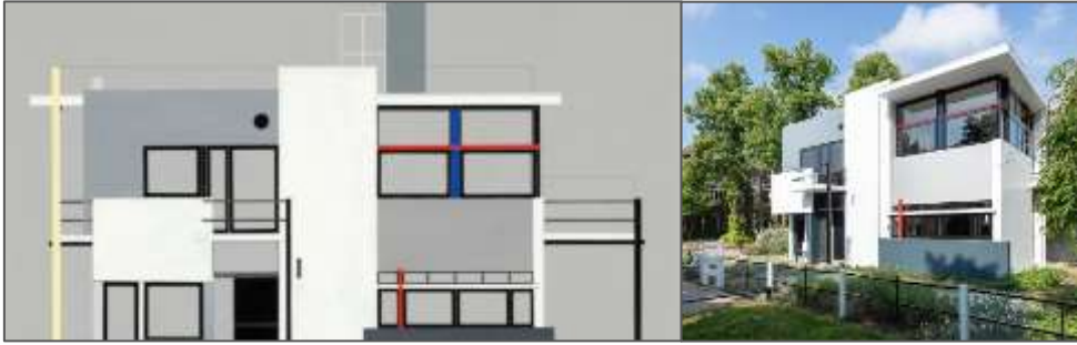
Fig.5 : La façade sud, Vue extérieure de la maison Schröder ,1924

Rietveld est également célèbre pour sa création emblématique, la chaise bleu-rouge, qui incarne parfaitement les principes du mouvement De Stijl (voir fig. 6).