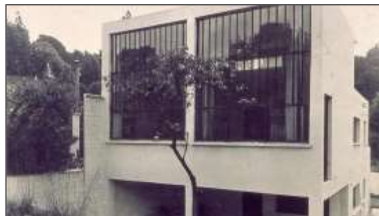
Fig.4 : Vue extérieure et façade de la maison-atelier