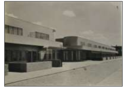
Fig.2 : Maisons ouvrières à Hoek

Ce projet représente un modèle d'urbanisme moderne, alliant simplicité et fonctionnalité. Conçu par J.J.P. Oud en 1917, il comprend un ensemble de maisons ouvrières sous forme de bandes, caractérisées par des volumes simples, une composition de parallélépipèdes, de surfaces lisses, la sérialité donnée par la répétition des modules, la symétrie, alignement et de hauteurs variées.