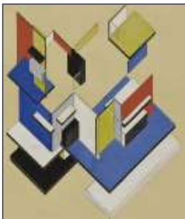
Fig.3 : Projet de Contre-Construction (axonométrie)

La maison-atelier, édifiée à Meudon entre 1929 et 1931, représente l'une de ses œuvres majeures et incarne parfaitement sa vision minimaliste (fig.4).