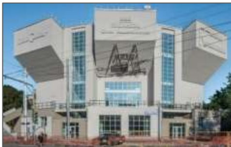
Fig.2 : Le cercle des travailleurs

- La Maison Melnikov : construite entre 1927 et 1929, est un exemple emblématique du constructivisme russe. À la fois résidence et cabinet d'architecte, elle est composée de deux cylindres percés de fenêtres hexagonales. L'intérieur, optimisé pour une utilisation efficace de l'espace, se caractérise par des pièces ouvertes et des éléments modulables, offrant un environnement à la fois rationnel et résolument moderne.