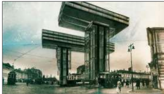
Fig.6 : Les gratte-ciels horizontaux

Ce projet incarne les idées novatrices de Lissitzky en matière d'urbanisme et d'architecture, dans le contexte de la société soviétique de l'époque. Bien qu'il s'agisse d'une proposition architecturale visionnaire, il est devenu une icône de l'architecture constructiviste et moderniste.