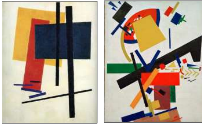
Fig.7 : Tableaux de Kazimir Malevich