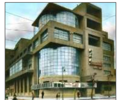
Fig.4 : Le Club des travailleurs de Zouïev

Le Club des travailleurs de Zouïev , conçu entre 1927 et 1929, est un édifice emblématique caractérisé par des formes géométriques dynamiques et une composition asymétrique. Il se compose de l'intersection de deux volumes distincts : un grand parallélépipède traversé par un cylindre transparent. Cette structure audacieuse et innovante incarne les principes du constructivisme, alliant fonctionnalité et esthétique moderniste.