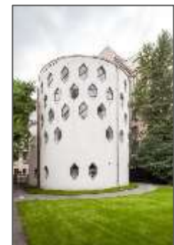
Fig.3 : Maison Melnikov