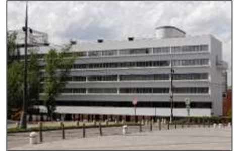
Fig.5 : Immeuble Narkomfin

Cependant, ce projet a rencontré plusieurs difficultés, notamment des problèmes d'entretien, un manque d'espace pour accueillir un grand nombre d'habitants, et l'échec du concept de vie communautaire tel qu'il avait été initialement envisagé. Malgré ces défis, il reste un exemple marquant de l'architecture moderniste et des utopies sociales de l'époque.