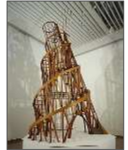
Fig.1 : Tour Tatline

Elle est conçue par Vladimir Tartin en 1920 à Saint-Pétersbourg en Russie. La tour Tatline est l'une des œuvres célèbres du constructivisme malgré qu'elle n'ait pas été réalisée, également appelée « le Monument à la Troisième Internationale ». Elle représente une structure monumentale en spirale, qui s'élève de 400 m. cette sculpture est composée d'une double hélice de couleur rouge se développant.