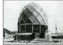
Fig.2 : Le Pavillon de verre de Bruno Taut

Conçu par l'architecte Bruno Taut pour l'exposition d'architecture moderne à Cologne en 1914, ce bâtiment illustre l'architecture moderne par ses formes épurées et l'utilisation de matériaux industriels. Il se divise en deux sections : une base en béton armé et une partie supérieure entièrement vitrée.