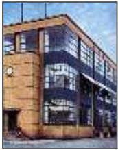
Fig.1 : Coin vitré_Usine Fagus

L'usine Fagus, présentée à l'exposition Werkbundaussstellung de 1914 à Cologne, incarne l'ambition du Deutscher Werkbund de démontrer que l'art et l'industrie pouvaient être harmonisés. L'usine constitue la première œuvre majeure de Gropius. Sa forme est épurée, sans ornementation. Dans ce projet, l'architecte a utilisé un mur-rideau totalement séparé de la structure porteuse. Il est l'un des premiers exemples d'architecture moderne. L'originalité de ce bâtiment réside dans l'utilisation d'une structure en béton armé, qui permet de dégager l'angle de la façade et d'y intégrer un mur-rideau sur trois étages.