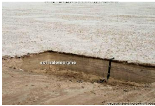
Figure 5: les Calcicols

Dans la région de Setif ou de M'Sila, l'agronome rencontre fréquemment :