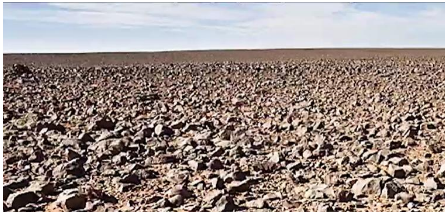
Figure 6 : Reg