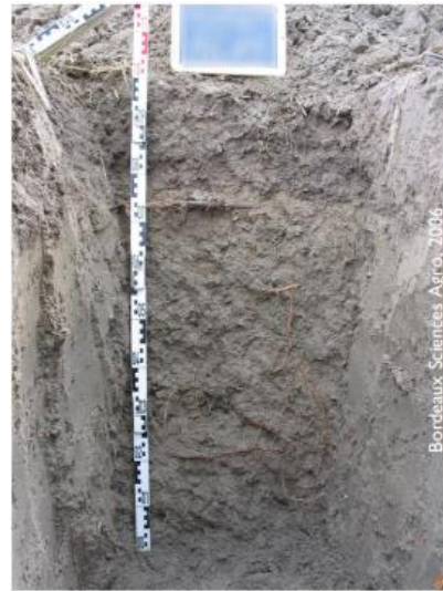
Figure 4: Les fluvisols