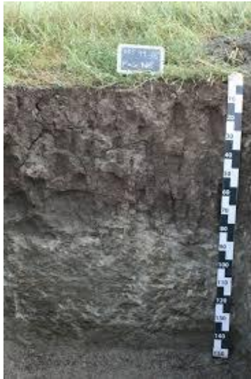
Figure 3: Les vertisols