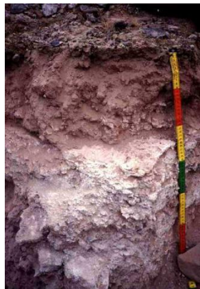
Figure 2: Sol calcicols