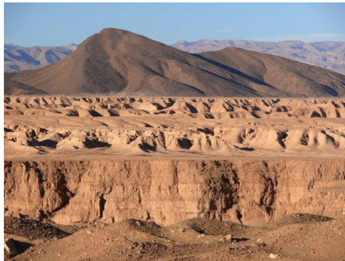
Figure 7: Hamada