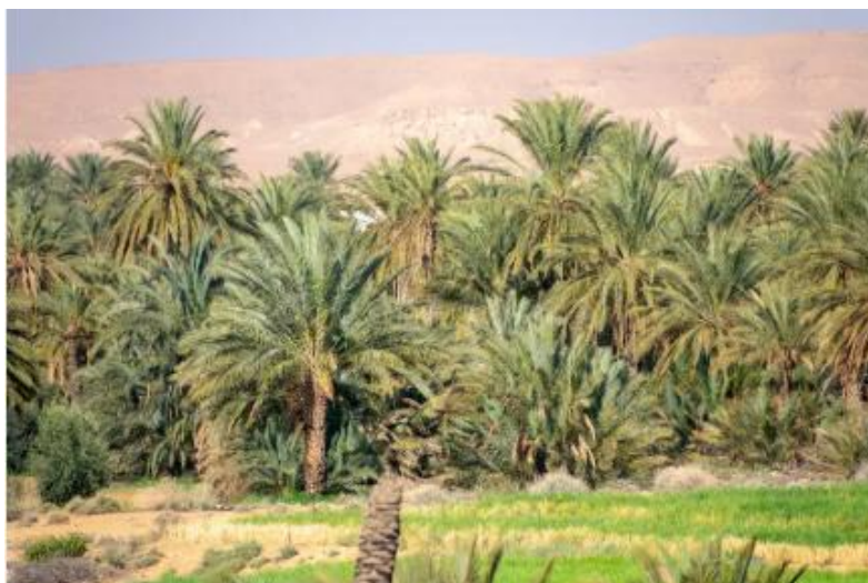
Figure 8: Oasis biskra