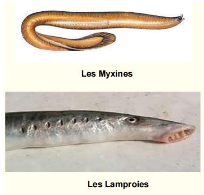
Figure 1 : Photos des Myxines et des Lamproies — représentants des Agnathes